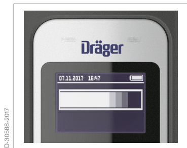
Символ «Идет процесс измерения»