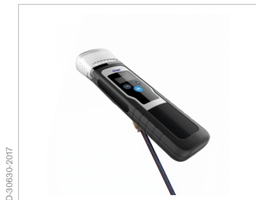
Резьба для крепления телескопической ручки