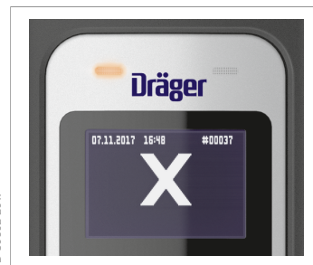
Символ «Алкоголь обнаружен»