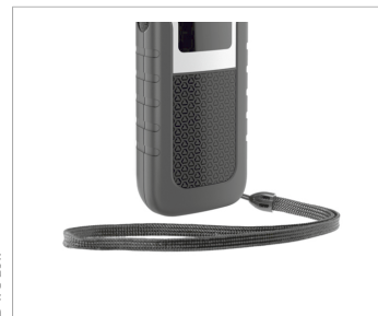
Ремешки на запястье