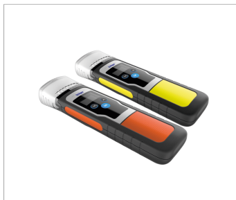
Комплект отражающей пленки: желтой или оранжевой (опция)